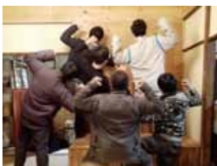
東峰西自治会集会所整備において改修作業に尽力したピースノートさんと宇都宮大学生・院生の皆さん

会員や有志により空き家の活用を支援する「空き家活用応援隊」。 まだ駆け出しの事業ですが、東峰西自治会でご協力いただいた(株)ピースノートさんのような仲間が増えることで、とんでもない面白いことが実現できるのではないかと。そんな期待の高い事業です。