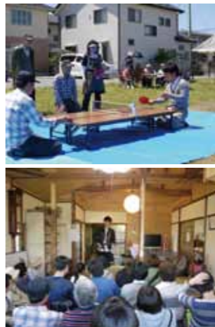
上) 東峰西自治会集会所オープンハウスの一コマ。地域住民 vs 宇大生 下) 集会所において学生のギター演奏。地域の方のハーモニカ演奏も

本会では、空き家の所有者・地域・若者・事業者などがつながるきっかけを支援するため、空き家に関連したイベントを開催しています。 集会所整備を支援した「東峰西自治会」では地元住民と宇都宮大学が共催したオープンハウスの開催。今後も新たな地域で計画が進行中です。