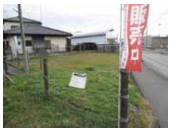
市有地売却物件も掲載中。

1,000万円以下の売却物件と8万円以下の戸建て賃貸物件を掲載中 宇都宮市と連携して取り組む「空き家・空き地活用バンク」においては、本会の協力事業者である不動産事業者と連携し、その不動産事業者が管理する物件をメインに情報発信しています。バンクに掲載している物件以外にも相談者が希望する条件に合致する物件をお探しの「マッチング事業」も継続しておりますので、併せてご利用ください。 また、新たに宇都宮市が管理する「市有地売却物件」の取扱いも始めましたので、物件をお探しの方はそちらもぜひご覧ください。